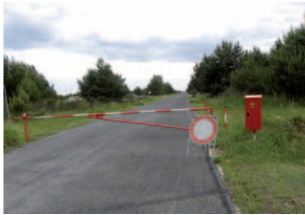
Abb. 03 Anschluss des Generalswegs an die L15

global betrachtet inzwischen von der Besiedlung auch dieser Teilfläche abhängig ist. In den meisten Fällen wird man dies verneinen.