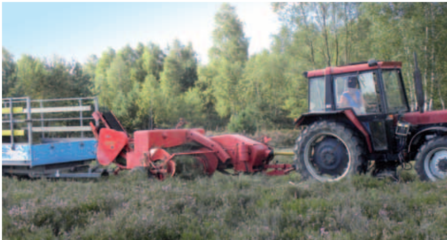
Abb. 17 Heidemahd in der „Glücksburger Heide“ bei Wittenberg in Sachsen-Anhalt

Ansätze gleichermaßen auf unterschiedlichen Teilflächen der Kyritz-Ruppiner Heide zu verfolgen (DNR 2010). Wahrscheinlich wird hierbei auch ein gewisser Pragmatismus greifen, da die Munitionsbelastung eine entscheidende Einschränkung für viele Managementmaßnahmen zur Folge hat oder sie für einen Teil der Fläche sogar ganz ausschließt.