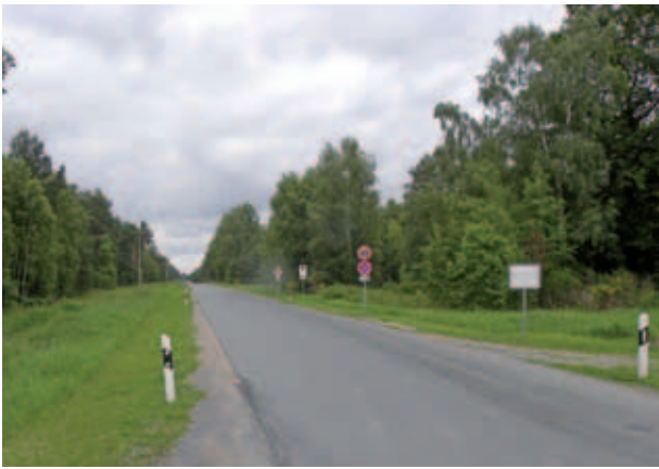
Abb. 02 Die Landesstraße 15 quert die Kyritz-Ruppiner Heide zwischen Schweinrich und Alt-Lutterow.

Mit der Großflächigkeit stehen weitere die Naturschutzqualität einer Fläche kennzeichnende Attribute im Zusammenhang – die Störungsarmut und die Unzerschnittenheit. Insbesondere störungsempfindliche Arten können in unserer intensiv genutzten Kulturlandschaft nur überleben, wenn ihnen störungsfreie Refugialräume zur Verfügung stehen. Darüber hinaus ist Deutschland als relativ dicht besiedeltes Industrieland von einem Netz von Verkehrs- und Leitungswegen durchzogen. Dieses Netz zerschneidet die Lebensräume von Arten und verhindert den genetischen Austausch von Individuen. Genetisch isolierte Vorkommen sind anfälliger für negativ wirkende Faktoren und ihre Aussterbewahrscheinlichkeit erhöht sich exponentiell (Mader 1981). Dieser Effekt ist selbst bei durch kommunale Straßen von geringer Verkehrsintensität getrennten Laufkäfer-Teilpopulationen nachweisbar (Mader 1981). Häufig wird das Vorkommen von speziellen Arten oder die Artenvielfalt als Kriterium der Schutzwürdigkeit bzw. -bedürftigkeit von Truppenübungsplätzen angeführt. Diesem Kriterium muss mit einer gewissen Zurückhaltung begegnet werden, da nur ein Teil der Arten nicht als direkte Folge einer intensiven militärischen Nutzung die Fläche besiedelt. Diese Arten kamen hier vor Beginn der militärischen Nutzung nicht vor und es muss in jedem Einzelfall geklärt werden, ob das Überleben der jeweiligen Art