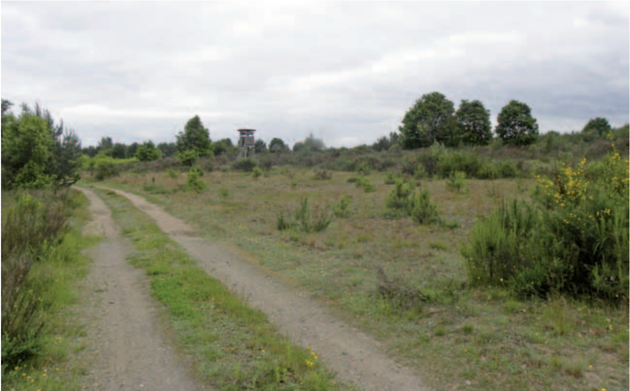
Abb. 05 Verbuschende Besenginster-Heiden prägen das Landschaftsbild am Lutterower Berg.