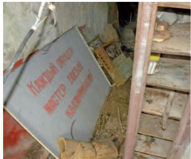
... Innenleben einer Bunkeranlage im Osten des Geländes