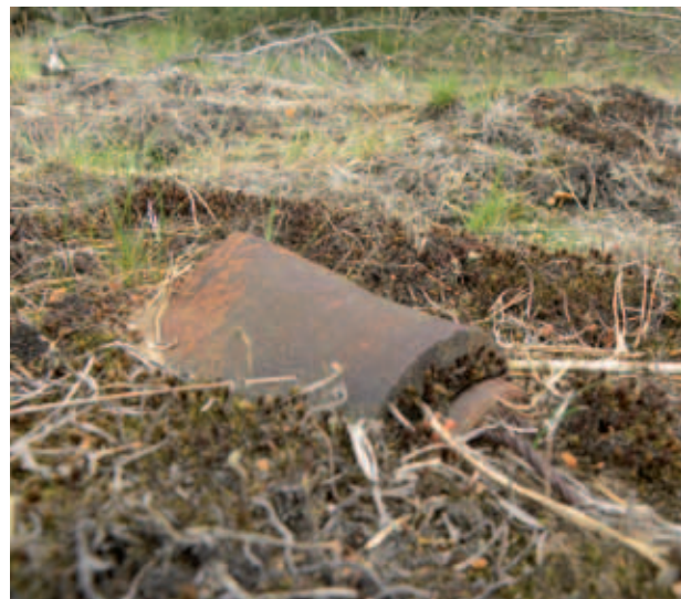
... versteckt liegende Granate

munition in erheblichem Umfang angenommen werden muss, ist von einem allgemein hohen Gefährdungspotenzial auszugehen. Jede, das Gelände des ehemaligen „Bombodroms“ betreffende Nutzung muss daher unter Beachtung des Vorsorgeprinzips unter Annahme des größtmöglicher Gefährdung (so genanntes „worst case Szenario“) geplant und durchgeführt werden (BMVBS & BMV 2007). Es gilt der Grundsatz, dass jede Nutzung des Geländes, bei der eine Gefährdung von Leib und Leben nicht ausgeschlossen werden kann, unzulässig ist. Hinsichtlich der Explosivstoffe in einem Teil der Kampfmittel sind Explosionsdruck und Splitterflug neben der Feuer-, Hitze- bzw. Brandwirkung und der Kontaktwirkung durch Vergiftung oder Verätzung (z.B. durch Nebel-, Kampf-, Spreng-, pyrotechnische Stoffe und Treibsätze) wichtige Hauptgefährdungsquellen. In Deutschland gilt das Rechtsprinzip der Verkehrssicherungspflicht des Grundeigentümers. Dieses Rechtsprinzip ist nicht durch ein Gesetz festgeschrieben, sondern wurde aus der allgemeinen Rechtsprechung bei flächenbezogenen Haftungsfragen entwickelt. Demzufolge ist der