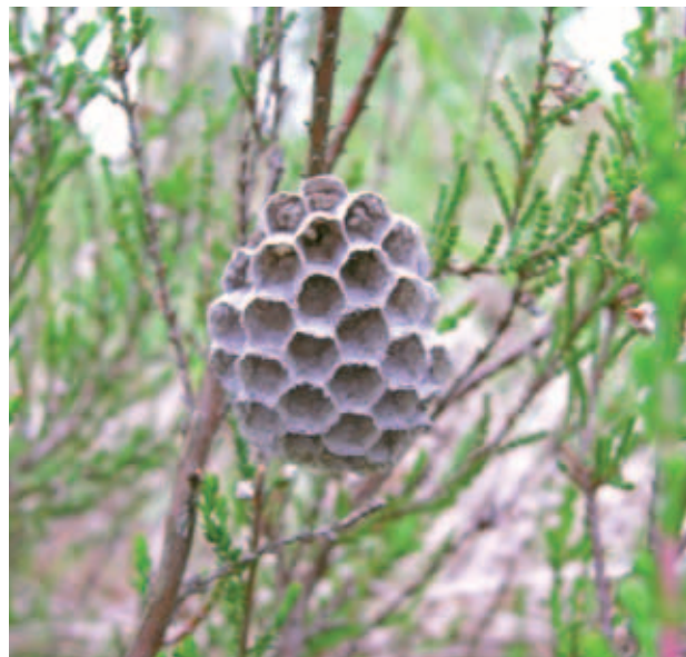
Abb. 09 Nest der Heide-Feldwespe ( Polistes nimpha ). Neben Heidekraut- und Ginster-Heiden werden auch lichte Vorwälder in hohen Dichten besiedelt.

Unter den Wirbeltieren sind einige Arten von herausragender Naturschutzbedeutung zu finden. Auch wenn es bislang keine systematische Untersuchung zur Säugetierfauna des Gebietes gegeben hat, so muss ihre Bedeutung insbesondere für eine Reihe von Fledermausarten und den Wolf hervorgehoben werden. Die Avifauna des Gebietes ist vergleichsweise gut bekannt. 74 Arten sind bislang für die Kyritz-Ruppiner Heide nachgewiesen worden (IfÖN 1993, NABU 2010), davon ein großer Teil als Brutvögel. Unter ihnen sind zahlreiche bestandsgefährdete und geschützte Arten zu finden. Die Kyritz-Ruppiner Heide liegt mitten im deutschen Vorkommensschwerpunkt des Fischadlers ( Pandion haliaetus ) und des Seeadlers ( Haliaeetus albicilla ) (Freude 2004). Beide Arten sind mit mehreren Horsten in der Peripherie des Geländes präsent. Diese Horststandorte bestanden auch zur Zeit der intensiven militärischen Übungen durch die Sowjetstreitkräfte, allerdings war der Bruterfolg signifikant niedriger, als nach dem Ende des Übungsbetriebes (NABU 2010). Als weitere hervorzuhebende Greifvogelarten sind der Wanderfalke ( Falco peregrinus ) und der Baumfalke ( Falco subbuteo ) zu nennen. Der Wanderfalke ist seit einigen Jahren auch wieder mit einem baumbrütenden Brutpaar auf dem Gelände der Kyritz-Ruppiner Heide vertreten. Die Rohrweihe ( Circus aeruginosus ), die Anfang der 1990er Jahre noch nachgewiesen werden konnte (IfÖN 1993), fehlt seit einigen Jahren offenbar