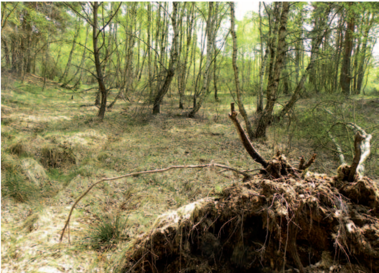
Abb. 06 Das Raderrang-Moor bei Zempow ist durch Entwässerung stark geschädigt.

Im Nordosten befinden sich kleine teils vermoorte Schmelzwasserrinnen, welche den Endmoränenzug durchbrechen. In diesen Rinnen liegen auch die stark verlandeten Seen (Raderrangsee und Philipp-See) und die einzigen flächenhaften Feuchtgebiete des Geländes. Die am stärksten ausgeprägten Böden des Geländes sind podsolige Braunerden und Braunerde-