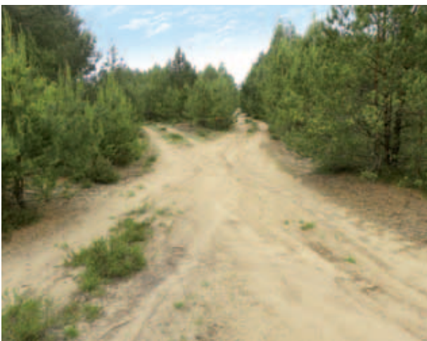
Abb. 04 Der größte Teil der Verkehrswege in der Kyritz-Ruppiner Heide besteht aus unverfestigten Sandwegen.