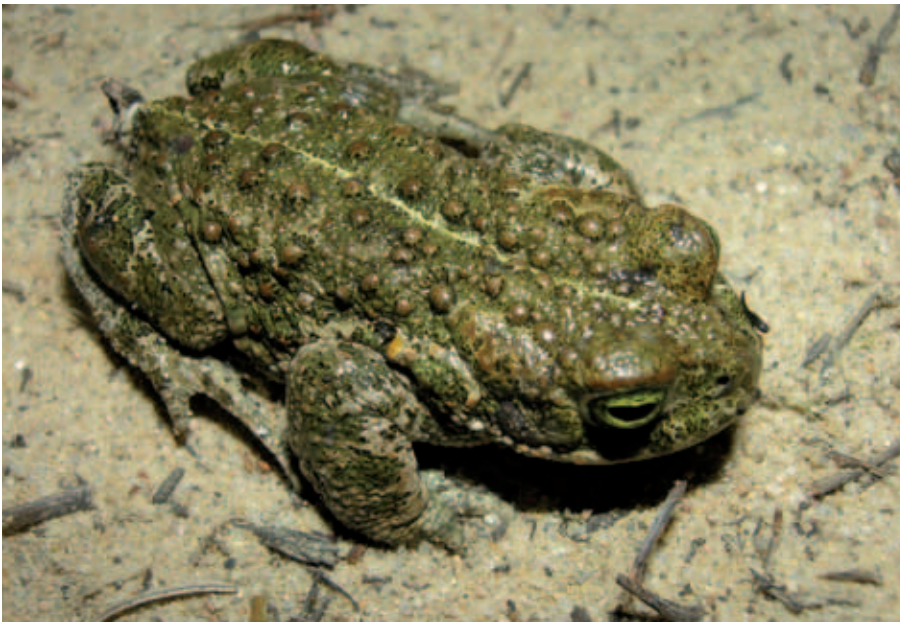
Abb. 10 Die Kreuzkröte ( Bufo calamita ) nutzt nur vegetationsfreie bis vegetationsarme Laichgewässer, wie die Kiesgruben bei Rossow und sogar wassergefüllte Wagenspuren.

vegetationsarmer bzw. vegetationsfreier Gewässer geltende Kreuzkröte zu nennen, die in den durch Kies- tagebau entstandenen Gewässern zwischen Rossow und Rägelin zeitweise eine überregional bedeutsame Population aufbaute. So wurden in den Jahren 2006 und 2007 im Mittel 450 Laichschnüre gezählt, was das Vorkommen zu einem deutschlandweit bedeutsamen Laichplatz machte. Seit der Einstellung des Kiestagebaus 2008 und der einsetzenden Sukzession ist der Bestand wieder stark rückläufig.