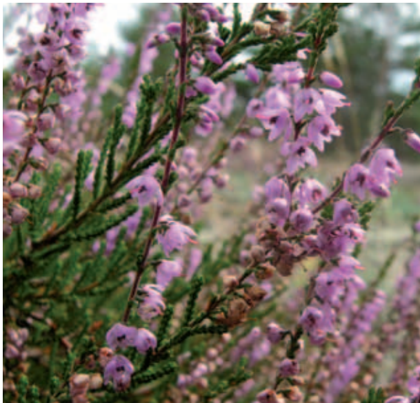
Abb. 12 Das Heidekraut ( Calluna vulgaris ) ist ein charakteristischer Zwergstrauch kalkarmer Sandböden und Charakterart von Heidelebensraumtypen.

Finck et al. 2009). Neben kontinuierlich wirkenden variablen Faktoren ist insbesondere die räumlich und zeitlich begrenzte Störung ein wichtiger Faktor eines Ökosystems. Neben extremen Witterungsereignissen und ihren Folgeprozessen (z.B. Windwurf und Brand) können auch innerökosystemare biologische Schwankungen (z.B. Kalamität phytophager Insekten) solche Störungen hervorrufen. Solche natürlichen Störungen sind für natürliche Systeme einerseits kennzeichnend, andererseits für das Inventar elementare Voraussetzung. Die Bestrebung des Menschen, dynamische Prozesse aus der Landschaft zu verbannen, führt zu beständigen Aufwendungen und ist ein Faktor für den Verlust biologischer Vielfalt (Perera et al. 2004).