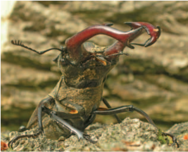
Abb. 08 Der Hirschkäfer ( Lucanus cervus ) lebt in den Alteichenbeständen insbesondere in der Peripherie der Kyritz-Ruppiner Heide.

tet. So wurden für die Biotoptypen Heidekraut., und Besenginsterheide, die Dünen mit Trockenrasen und die Sandtrockenrasen nur unter 30 Pflanzenarten