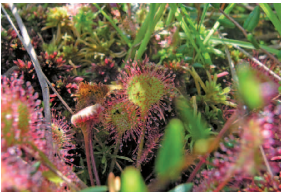
Abb. 15 Der Rundblättrige Sonnentau ( Drosera rotundifolia ) kommt kleinflächig im Raderrang-Moor vor

Rand des Platzes liegenden Quellbereiche der in die Dosse entwässernden Bäche und Gräben. Einen starken Degenerationsgrad weist das Raderrang-Moor auf, wo noch Anfang der 1990er Jahre neben Großseggenrieden auch Rudimente von Torfmoosgesellschaften mit Gemeiner Moosbeere und Rundblättrigem Sonnentau vorkamen, die aktuell dort nicht mehr als Gesellschaften festgestellt werden konnten und die Charakterarten nur noch fragmentarisch vorkommen. Ursache hierfür ist eine dramatische Grundwasserabsenkung um ca. 2 m in den 1980er Jahren, welche ihre Ursache in den Ausbaumaßnahmen im Entwässerungssystem vor allem im angrenzenden Bundesland Mecklenburg-Vorpommern hatte.