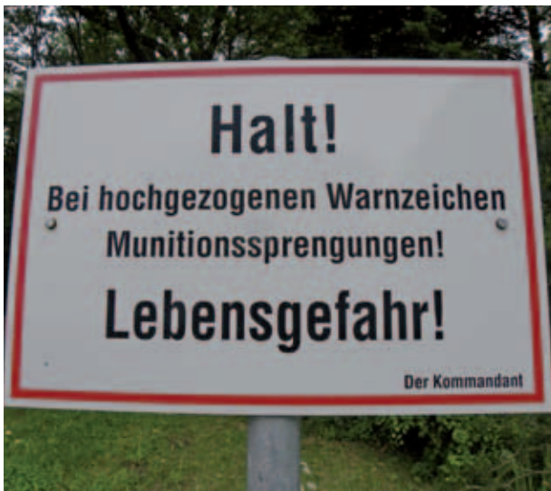
... Beschilderung weist auf Gefahrensituation hin

munition in erheblichem Umfang angenommen werden muss, ist von einem allgemein hohen Gefährdungspotenzial auszugehen. Jede, das Gelände des ehemaligen „Bombodroms“ betreffende Nutzung muss daher unter Beachtung des Vorsorgeprinzips unter Annahme des größtmöglicher Gefährdung (so genanntes „worst case Szenario“) geplant und durchgeführt werden (BMVBS & BMV 2007). Es gilt der Grundsatz, dass jede Nutzung des Geländes, bei der eine Gefährdung von Leib und Leben nicht ausgeschlossen werden kann, unzulässig ist. Hinsichtlich der Explosivstoffe in einem Teil der Kampfmittel sind Explosionsdruck und Splitterflug neben der Feuer-, Hitze- bzw. Brandwirkung und der Kontaktwirkung durch Vergiftung oder Verätzung (z.B. durch Nebel-, Kampf-, Spreng-, pyrotechnische Stoffe und Treibsätze) wichtige Hauptgefährdungsquellen. In Deutschland gilt das Rechtsprinzip der Verkehrssicherungspflicht des Grundeigentümers. Dieses Rechtsprinzip ist nicht durch ein Gesetz festgeschrieben, sondern wurde aus der allgemeinen Rechtsprechung bei flächenbezogenen Haftungsfragen entwickelt. Demzufolge ist der