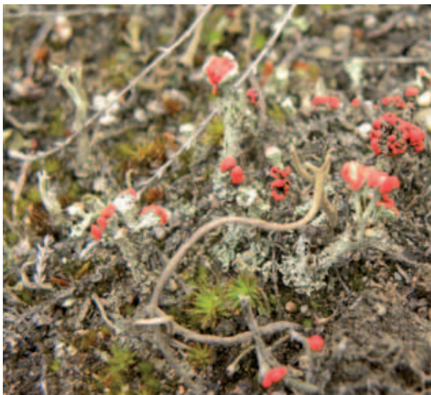
Abb. 13 Flechtenrasen bilden großflächige Bestände und stellen die erste Sukzessionsstufe dar

Im Ergebnis der militärischen Nutzung der Fläche, inklusive diverser Brände und steter Fahrzeugbewegungen war zum Jahre 1991/92 als der Übungsbetrieb