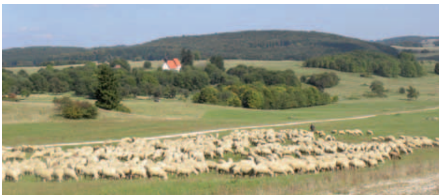
Abb. 18 Schafbeweidung auf dem ehemaligen Truppenübungsplatz Münsingen in Baden-Württemberg. Bis zu 25.000 Schafe werden hier im Hütetrieb zur Landschaftspflege eingesetzt. Dies ist in der Schwäbischen Alb im Gegensatz zur Kyritz-Ruppiner Heide eine traditionelle Kulturlandschaftsnutzung.