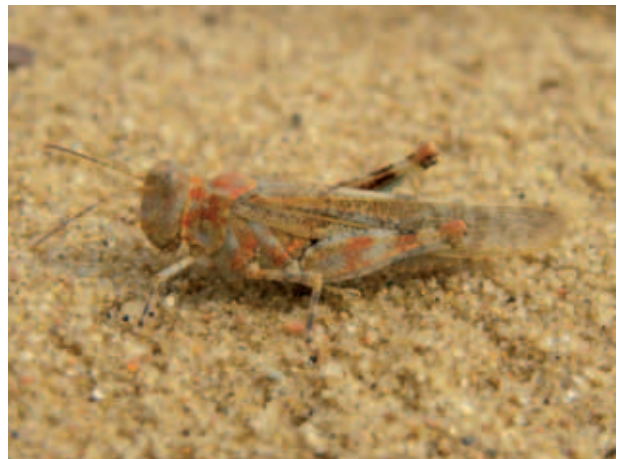
Abb. 07 Die Blauflügelige Ödlandschrecke ( Oedipoda caerulea ) kommt auf Sandtrockenrasen und Offensandflächen in hohen Dichten vor.

Über die Artenausstattung des Geländes liegen im Vergleich zu anderen ehemaligen Truppenübungsplätzen nur wenige Daten vor. Der überwiegende Teil davon wurde in den Jahren 1992-1995 erhoben. Untersuchungen zur Vegetation und Flora des Geländes sowie zu ausgewählten Vogelarten erfolgten durch das Amt für Geoinformationswesen der Bundeswehr im Zusammenhang mit der Erstellung des Benutzungs- und Bodenbedeckungsplans (AGB 2007). Seitens der Bundeswehr erfolgten darüber hinausgehende Untersuchungen auch nicht im Zusammenhang mit der verwaltungsgerichtlichen Auseinandersetzung zwischen den anerkannten Naturschutzverbänden NABU Brandenburg und BUND Mecklenburg-Vorpommern (AGB 2003, NABU 2010). Ausgewählte Artengruppen wurden nur in der Peripherie des Geländes durch ehrenamtliche Spezialistinnen und Spezialisten in späteren Jahren untersucht (Oldorff 2005, NABU 2010). Eine Ausnahme bilden bei der Fauna die Greifvogelarten Fisch- und Seeadler sowie Wanderfalke, die seit den späten 1970er Jahren kontinuierlich im Rahmen eines durch die Martin-Luther-Universität Halle koordinierten Monitorings hinsichtlich Präsenz und Bruterfolg untersucht wurden (NABU 2010). Seit sich im Jahr 2008 die Hinweise auf die Ansiedlung eines stationären Wolfes verdichteten, finden Untersuchungen zum Vorkommen dieser Säugetierart statt (Anon. 2009). Es ist davon auszugehen, dass die Artenausstattung des Gebietes ungleich reichhaltiger ist, als dies die spärlich vorliegenden gesicherten Nachweise andeuten.