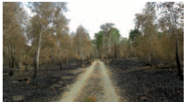
Abb. 20 Brandfläche nach durch Selbstentzündung von Munition entstandenem Wildfeuer auf dem ehemaligen Truppenübungsplatz „Jüterbog-West“ im Juli 2010. Im Rahmen eines abgestimmten Waldbrandschutzkonzeptes wird ein Übergreifen des Feuers durch Löschen an einem entmunitionierten Schutzstreifen verhindert.