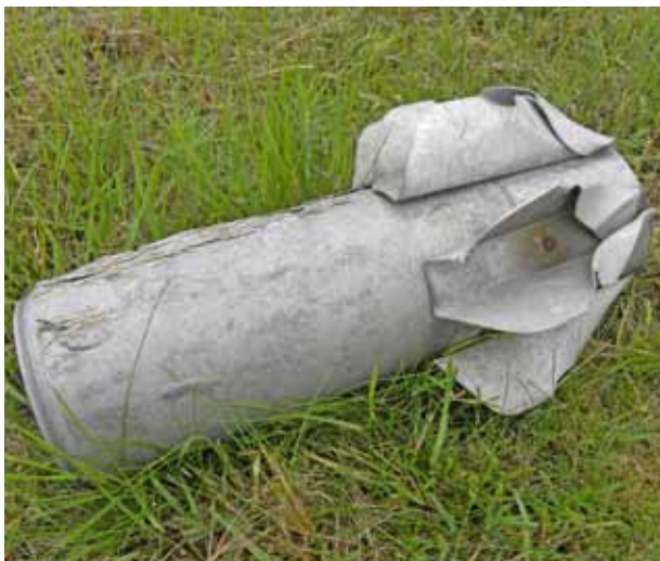
Abb. 16 Komplexe Belastungen durch Hinterlassenschaften der WGT, z. B. Flugkörperreste ...

Die bislang aufgefundenen Kampfmittel verdeutlichen, dass nahezu das gesamte „Repertoire“ vorhanden ist. Hierzu zählt Pioniermunition, Hand-, Gewehr- und Panzerfaustgranaten, Munition für Handwaffen und Maschinengewehre (< 12,7 mm), Rohrwaffenmunition (Panzer-, Artilleriemunition), Minen, Werfer- und Mörsermunition, gesteuerte Flugkörper und Raketen sowie Abwurfmunition (Spreng-, Splitter- und Brandbomben). Neben den durch Einsatz distribuierten Kampfmitteln sind lokal auch Vergrabungen festzustellen. Da Art und Umfang der Ablagerungen und Rückstände unbekannt sind, das Auftreten giftiger und wassergefährdender Stoffe nicht auszuschließen ist und das Vorkommen von Kampfstoffen und Mu-