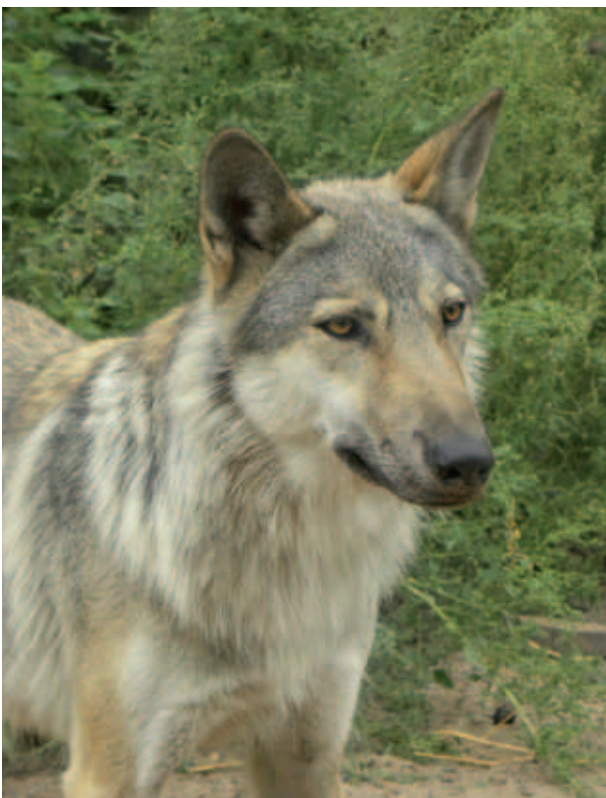
Abb. 11 Das am stärksten gefährdete Säugetier Mitteleuropas – der Wolf ( Canis lupus ) hat die Kyritz-Ruppiner Heide natürlich wiederbesiedelt. Störungsarme Rückzugsräume sind gerade für diese Art in Kulturlandschaften besonders wichtig.