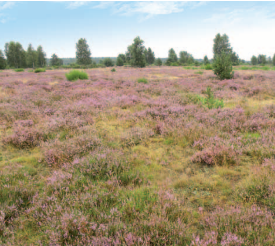
Abb. 14 Ein Mosaik aus Sandtrockenrasen, Heidekraut- und Besenginsterheiden mit einsetzender Bewaldung prägt den zentralen Teil des Geländes

Typischerweise liegt der Fokus der Betrachtung bei der Erhaltung der Lebensräume auf ehemaligen Truppenübungsplätzen auf den offenen und halboffenen Trockenhabitaten und verglichen mit anderen Flächen wie etwa der Döberitzer Heide, Heidehof oder Lieberose ist der Flächenanteil von Feuchtgebieten in der Kyritz-Ruppiner Heide als gering einzuschätzen. Nichtsdestoweniger sind insbesondere im Norden des Geländes zwischen Zempow und Neu Lutterow hydrologisch stark anthropogen veränderte Feuchtgebiete erhalten geblieben. Hier besteht eine Priorität für die Restaurierung des Landschaftswasserhaushaltes insbesondere im Bereich des nördlichen Endmoränenzuges und der darin eingebetteten bzw. vorgelagerten Niederungsbereiche sowie der am südwestlichen